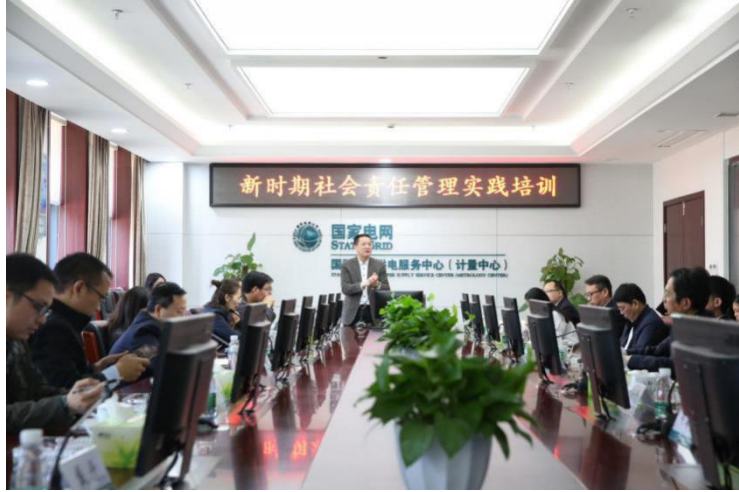
图：开展社会责任管理培训