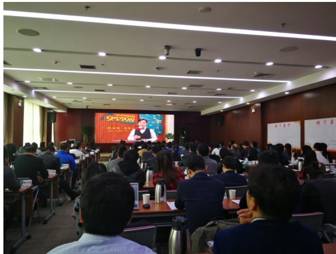
图：国网公司培训会上展示社会责任管理成果

3月21日,中心代表在国网公司培训会上做社会责任示范基地交流发言。中心从社会责任管理历程、“透明服务”主题实践和今后工作思路三方面,将中心社会责任管理推进和实践成果以及上下联动、全员投入的积极状态,以讲解加视频的形式展现在全系统内社会责任管理推进战线的同仁面前。下一阶段,中心将整合多元化的可视化成果,通过富媒体传播形式,将“透明服务”管理的先进理念、亮点实践等进行广泛推广与传播,打造有故事、可传播、可感知的品牌形象。