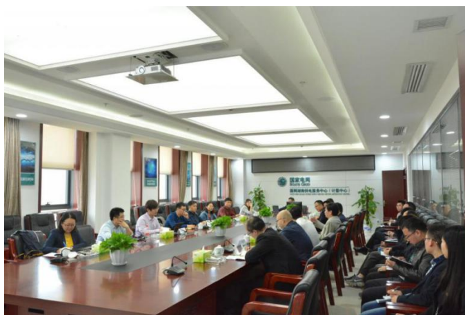
图：中心绩效会对社会责任工作做出系统部署

3月5日，中心召开季度绩效大会，将社会责任管理工作作为中心全年重点工作之一进行了系统部署。会议明确了2018年度中心社会责任管理工作将从管理推进和业务融合两大层面入手，并通过激烈讨论梳理出目前社会责任管理存在的五大重点问题：理念理解与应用不深、全员参与程度不足、自运行机制尚未完全建立、缺乏有效的品牌传播和推广机制、社会责任管理理念及方法尚未完全融入中心运营核心难点及重点工作之中。下阶段，中心将制定针对性的完善措施，并落实好各项工作的责任主体及时间节点要求，加强沟通衔接、提高工作质效、严控节点、按期督办，保质保量完成各阶段的工作任务，充分发挥好社会责任管理对中心运营的推动和提升作用。