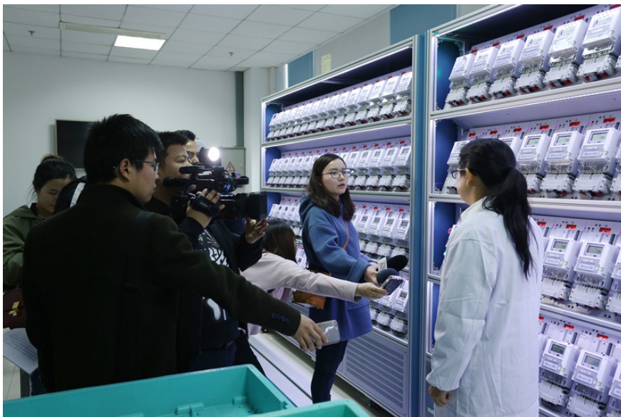
图：媒体记者采访中心工作人员

3月16日，中心邀请湖南日报、湖南卫视、湖南都视、政法频道、三湘都市报、潇湘晨报等一批主流媒体到中心参观湖南首个电能计量器具全自动检定仓储一体化系统，就电能表免费轮换改造工作向媒体进行介绍和答疑，向社会传递“精准精细”的工匠精神和“阳光计量、透明服务”的工作理念。此次活动，是中心持续推进“阳光智能计量”工程的重要实践内容之一，也是中心达成“与媒体同步”履责目标的核心工作之一。未来，中心将充分利用好“阳光智能计量”工程的开放平台，不断深化中心在利益相关方心中“公平公正、科学准确”的企业形象，一如既往为公众“放心用电、无忧用电”保驾护航，为湖南“品质消费、美好生活”增添助力。