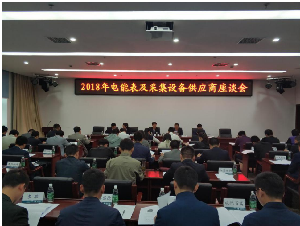
图：中心召开 2018 年电能表及采集设备供应商座谈会

为了进一步搭建公平、公正、公开的合作平台，中心持续深化与供应商的沟通与交流。4月13日，秉持相互合作、共同进步的理念，中心邀请57家电能表、采集设备供应商共同出席2018年电能表及采集设备供应商座谈会。会上，参会各方对先进技术和优秀经验进行了交流与分享，并明确了共建共享、和谐发展的合作目标和前进方向。此次会议，为今后中心和供应商之间、供应商与供应商之间在技术革新、管理提质等方面的相互沟通和协作创造了良好的契机，也为全省计量器具的高质量供应打下了良好的发展基础。