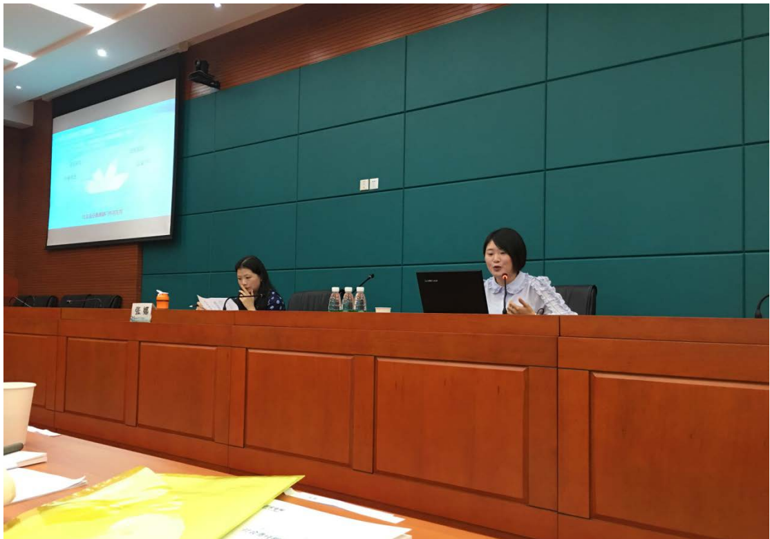
图4 綦南公司参加市公司全面社会责任管理培训

4.参与重庆公司全面社会责任管理培训。4月20日，重庆公司举办年度社会责任专题培训，来自42家基层单位的社会责任管理部门负责人和专责120余人参与了培训，綦南公司作为国网公司社会责任示范基地，用半天的时间，分享了全面社会责任管理工作开展情况和社会责任根植项目培育经验。全面社会责任管理工作主要从理念植入、能力提升、沟通传播、绩效评价、管理工具、机制保障等6个方面分享，社会责任根植项目培育主要从调研论证、选题立项、策划实施、评价总结、改进提升5个环节进行分享，课间还进行了问答互动。