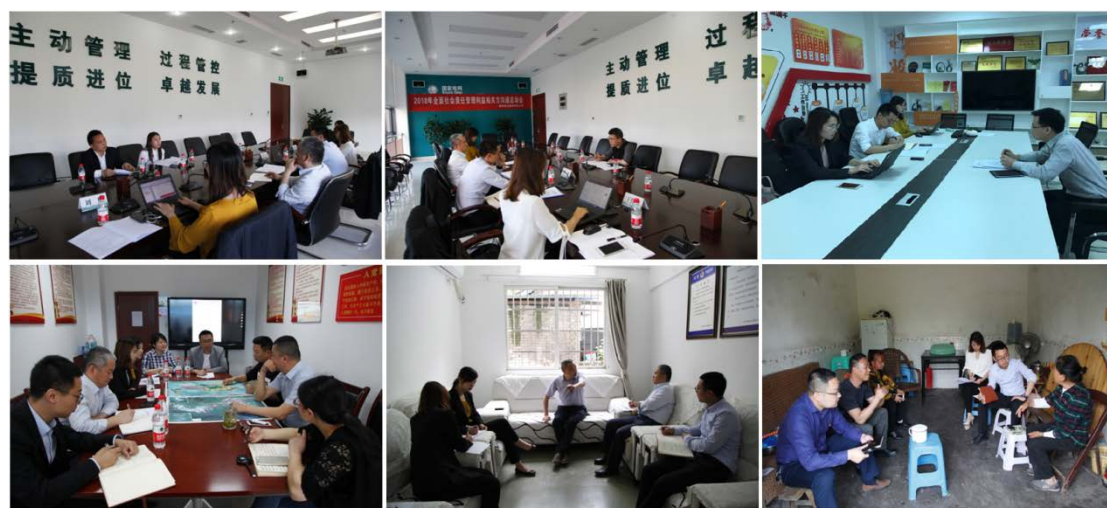
图 2 内外部利益相关方沟通访谈情况