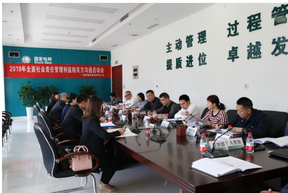
图 1 全面社会责任管理利益相关方沟通启动会

年客户，企业客户选择了包含医院、燃气等公共服务企业和长风锻造等地方支柱型企业。通过调研发现，公司整体履责意识、态度、质量较前几年均有较大改观，但在社会责任融入全面管理上还有一定的差距，下阶段将针对调研发言问题进一步优化全面社会责任管理年度工作计划。